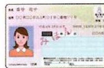
現在お持ちのマイナンバーカード